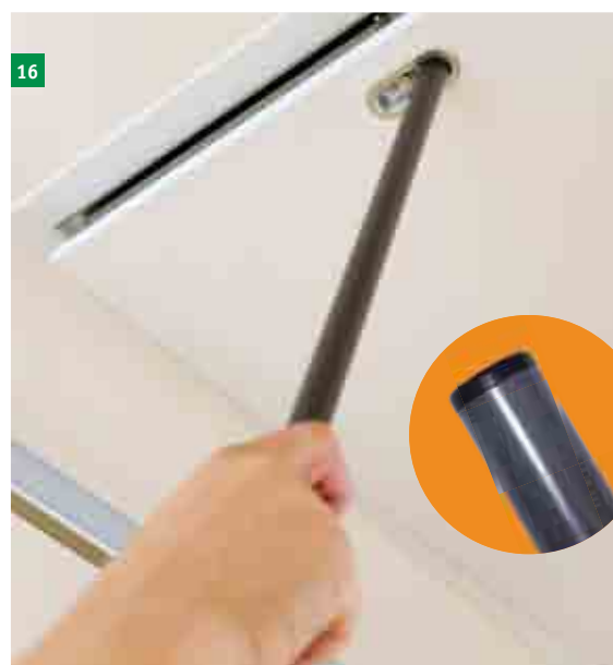
16 druhá strana stahovací tyče je opatřena plastovou koncovkou, kterou se víko uzavře