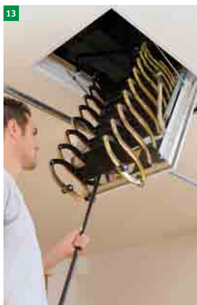
13 stažení schodů pomocí stahovací tyče