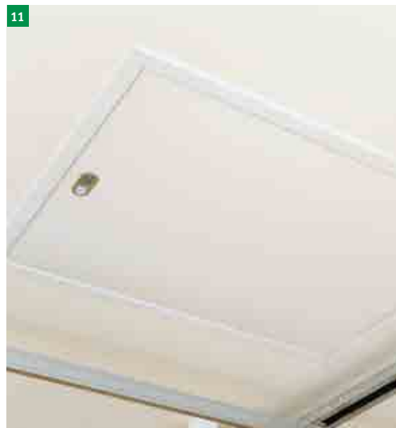
11 vsazené a utažené stahovací schody ve stropním otvoru