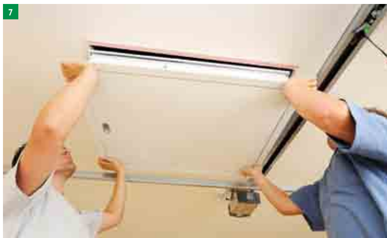
7 vsazení schodů do stavebního otvoru