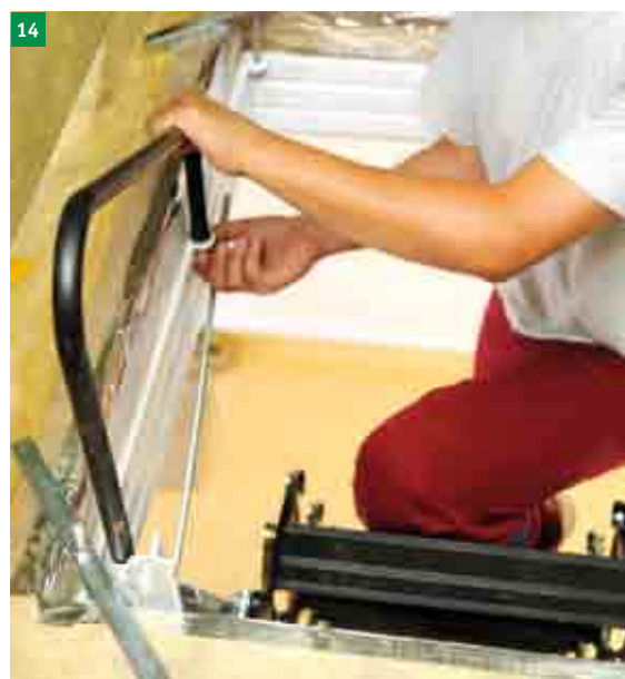
14 nasazení a přišroubování madla na rám schodů