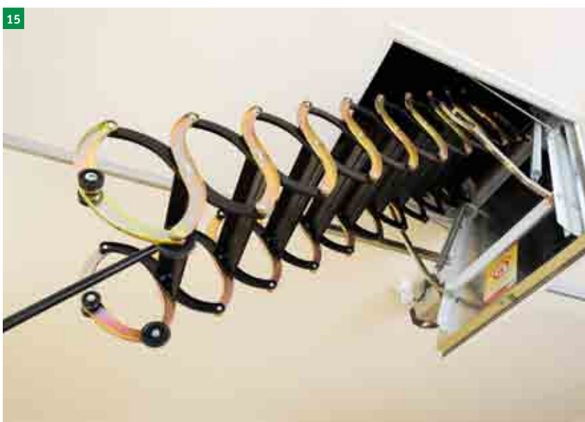
15 složení schodů pomocí stahovací tyče