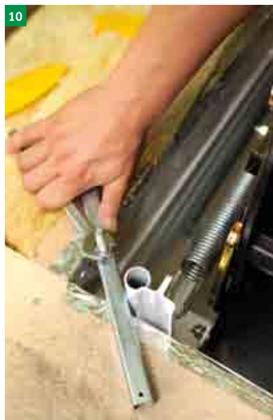
10 řádné utažení 4 ks kotevních šroubů